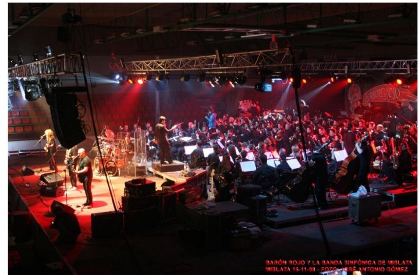
BARÓN ROJO Y LA BANDA SINFÓNICA DE MISLATA MISLATA 14-11-08