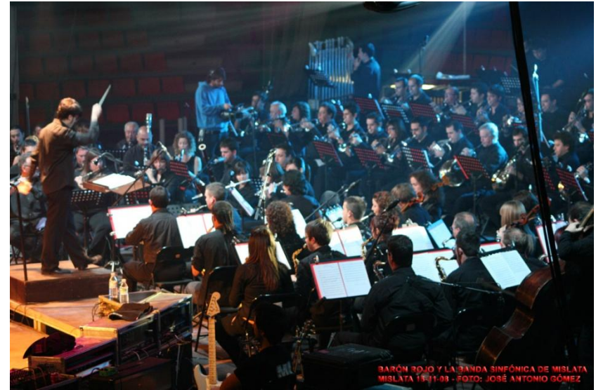
BARÓN ROJO Y LA BANDA SINFÓNICA DE MISLATA MISLATA 14-11-08